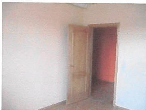
St. Petersburg 28.-29.04.08 045.jpg 1182K