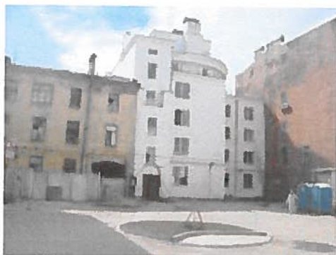
St. Petersburg 28.-29.04.08 043.jpg 1498K