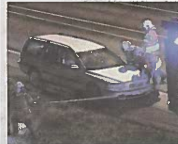
Pelastajat löysivät kaiteeseen törmänneen Volvon tyhjiinään.